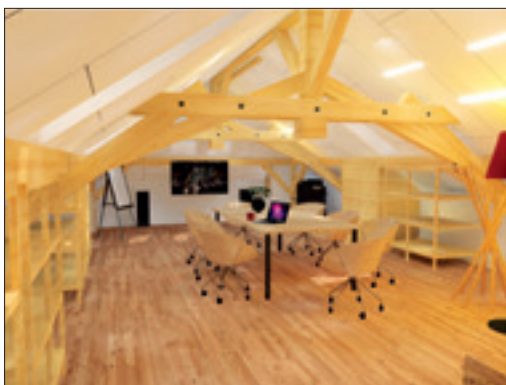
Künftiger Besprechungsraum (heute ungenutzter Estrich)

Abschliessend war das konstante Defizit an Flächen für die gemeindeeigenen Nutzungen massgebend für den Antrag der Integration, d. h. der Auflösung der Dachwohnung und der Aktivierung des Estrichs. Die neu verfügbaren Flächen sollen in die Gemeindestruktur integriert werden (ca. 310 m 2 Nettofläche über beide Dachgeschosse). Die bestehende Tragstruktur ermöglicht eine einfache, flexible Anordnung von Büroräumlichkeiten.