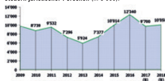
Steuern juristischer Personen (in 1'000):

Nachstehende Grafik zeigt die enorme Schwankungsbreite bei den Steuern juristischer Personen. Natürlich ist dabei der Einfluss der Steuerergebnisse der Lonza AG von zentraler Bedeutung. Der Steuerertrag bei den juristischen Personen beinhaltet die Gewinn-, Kapital- und Grundstücksteuern. Der Steuerertrag juristischer Personen ist für die Gemeinde Visp von grosser Bedeutung, beträgt doch deren Anteil am gesamten Steuervolumen rund 34%.