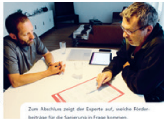
Zum Abschluss zeigt der Experte auf, welche Förderbeiträge für die Sanierung in Frage kommen.

Auf der Internetseite www.energieberatung-oberwallis.ch sind die Beratungsthemen im Detail aufgeführt. Interessierte können sich einen Überblick mit Links und Ratgebern zu den verschiedenen Themen verschaffen. Eine Erstberatung per Telefon, via E-Mail oder im Büro in Naters ist kostenlos.